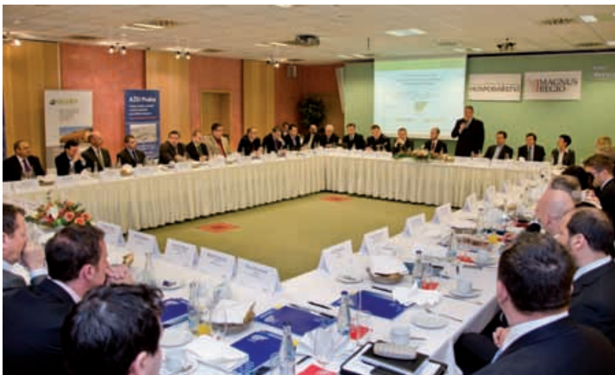
Úvodní slova na business snídani Bezpečná dopravní infrastruktura v Jihomoravském kraji se ujal náměstek hejtmána Jihomoravského kraje Václav Horák.

Ke zvýšení bezpečnosti je zapotřebí modernizovat zastaralou silniční síť, využívat moderní bezpečnostní prvky, zklidňovat dopravu ve městech a obcích, odstraňovat riziková místa a zavádět inteligentní prvky řízení a usměrňování dopravního proudu i s kontrolním mechanismem.