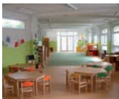
Interiér modulové školky

„V březnu 2010 se do naší školky přihlásil dvojnásobek dětí, než jaká byla