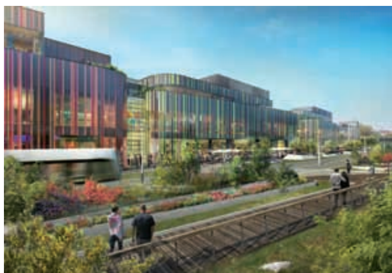
PŮLMILIARDOVÝ PROJEKT Město Olomouc ve spolupráci s investorem nové čtvrti Šantovka připravuje souběžně výstavbu tramvajové tratě přes areál bývalého závodu Mila do jižní části města.

Více než půl miliardy by měl stát projekt velkého olomouckého plánu výstavby tramvajové tratě přes areál bývalého závodu Mila k sídlištím na jihu. Město už zahájilo přípravné práce. Tramvajovou trať na Nové Sady zatím financuje město spolu se společností SMC Development, která staví budoucí čtvrť Šantovku. Projekt tramvajové trati má ale velkou naději