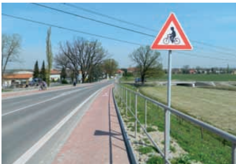
Cyklostezky neslouží jen k aktivnímu trávení volného času, ale jsou nedílnou součástí dopravního systému. V celé České republice vznikají nové stezky, na prvním místě je bezpečnost cyklistů.

Nejdelší a nejatraktivnější bude nová cyklostezka Odra–Morava–Dunaj napříč Ostravou a chráněnou krajinnou oblastí Poodří. „Největší část cyklostezky, přes 14 z celkových 19 kilometrů, povede Ostravou podél řeky Odry. Zbývající úseky vzniknou v Chráněné krajinné oblasti Poodří jako počátek budoucího propojení celé oblasti až k hranicím s Olomouckým krajem,“ popisuje záměr Kateřina Křenková, předsedkyně Regionu Poodří a starostka Bartošovic. Dotace pro Region Poodří na vznik 19 kilometrů nových stezek je přes 53 milionů korun. Celkové výdaje jsou vyčísleny na 67 milionů korun.