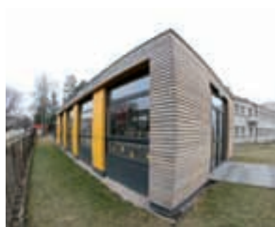
Modulová MŠ Poříčany

Nespornou výhodou modulových školek není jen nižší cena a rychlost výstavby, ale i jejich variabilita. Ta obcím mj. umožní pružně reagovat na situaci, až současný baby boom opadne. Modulovou školku lze totiž snadno přestavět, případně kompletně rozebrat a převést na jiné místo. „Moduly navíc není nutné přímo kupovat, ale je možné si je i dlouhodobě pronajmout. Dalším úsporným řešením