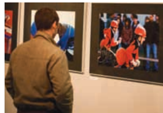
Vítězná fotografie na vernisáži v Galerii Plamínek