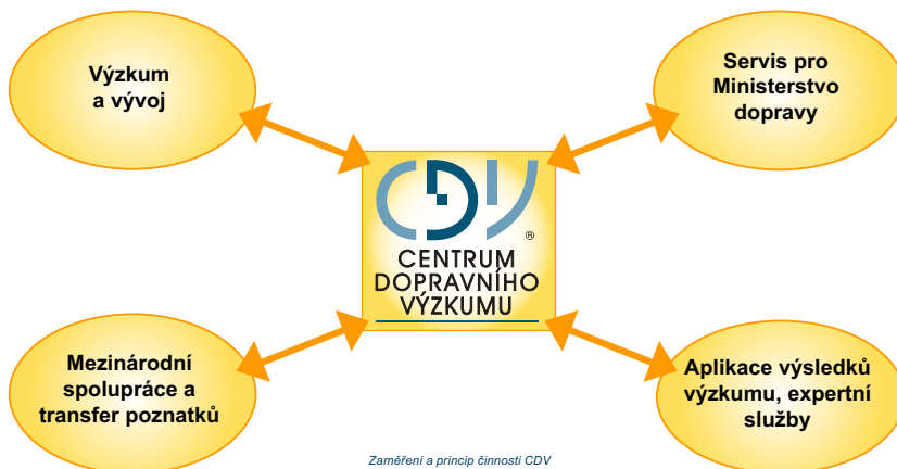
Zaměření a princip činnosti CDV