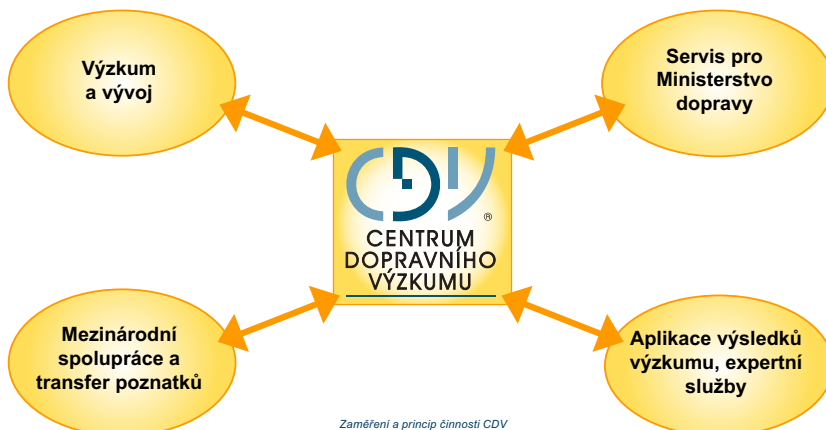
Zaměření a princip činnosti CDV