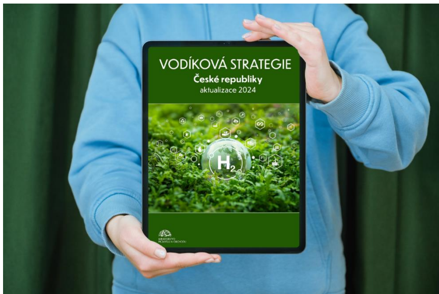
Obrázek 1 Vodíková strategie ČR, dostupná na https://www.mpo.gov.cz/assets/cz/prumysl/strategicke-projekty/2024/7/Vodikova-strategie-CR-aktualizace-2024.pdf

Vláda České republiky schválila aktualizovanou verzi Vodíkové strategie ČR, která stanovuje cestu k rozvoji a využití vodíkových technologií v České republice. Tento významný krok navazuje na požadavky Evropské komise a představuje důležitý milník v úsilí o dosažení klimatických cílů a závazků ČR.