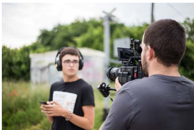
Fotografie z natáčení: archiv CDV