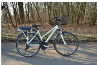
Cyklista nedostal přednost v jízdě (střetová rychlost 15 km/h) cyklista neměl přílbu, lehké zranění