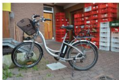
Nedání přednosti v jízdě (střetová rychlost 15 km/h) cyklista neměl přílbu, lehké zranění