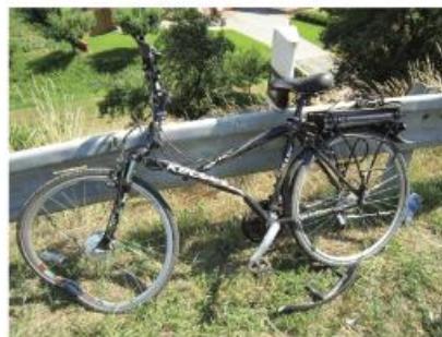
Vjezí do protisměru (střetová rychlost 30 km/h) cyklista měl přílbu, lehké zranění