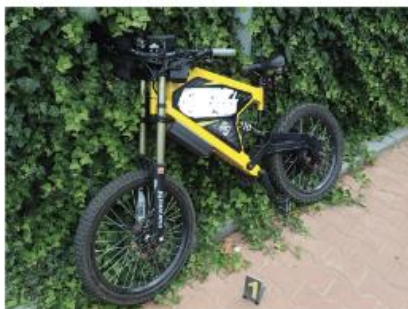
Nezákonný výkon a rychlost (střetová rychlost 15 km/h) cyklista neměl přílbu, těžké zranění