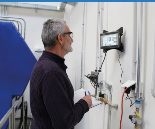
Displej ovládání a měření úrovně hladin pomocí SW