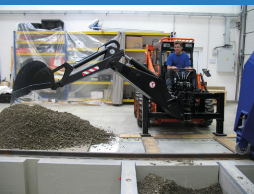
Navážení a těžení materiálu v LGZP