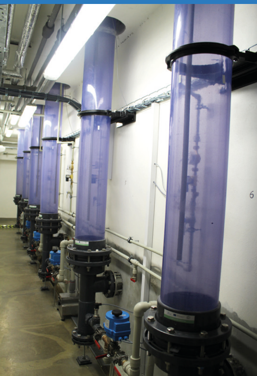
Měřicí válce s prvky ovládání