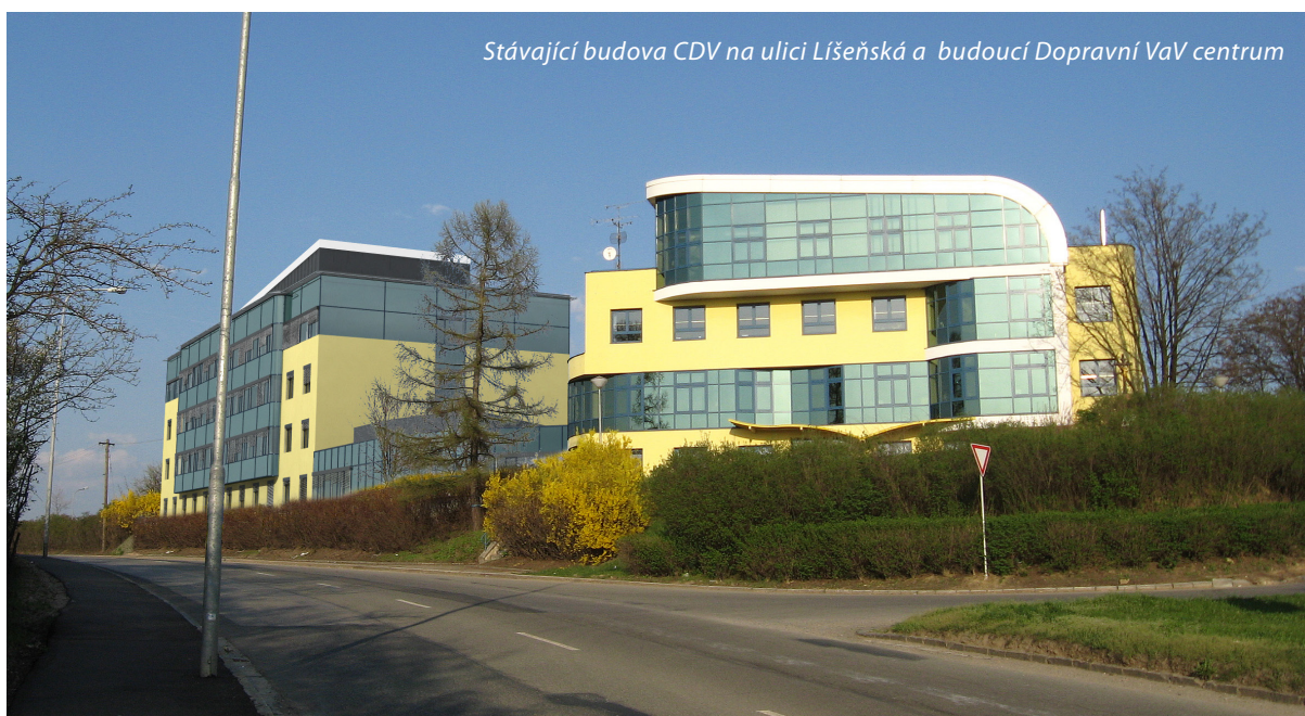
Stávající budova CDV na ulici Líšeňská a budoucí Dopravní VaV centrum

Cílem projektu Dopravní VaV centrum (dále Centrum) je vybudovat a vytvořit jedinečné výzkumné zázemí, které prostřednictvím svých laboratoří, vybavení a know-how bude poskytovat komplexní prostředí pro výzkum ve vybraných disciplínách dopravních aplikovaných věd, a přispívat tak k optimálnímu rozvoji dopravního sektoru, nejen v regionu. Rozmanitost výzkumu Centra odpovídá potřebám i trendům současného dopravního výzkumu.