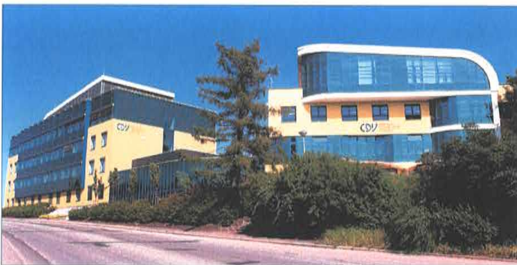
Obr. 1: Budova CDV na ulici Lišeňská a Dopravní VaV centrum.

Realizace projektu byla ukončena v prosinci 2014. Udržitelnost projektu je sledována do konce roku 2019.